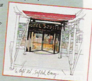
le Café Ké, Sofitel Bercy

Office du tourisme Paris, 25, rue des Pyramides, 75001 Paris. Tél. : 0 892 683 000. www.parisinfo.com